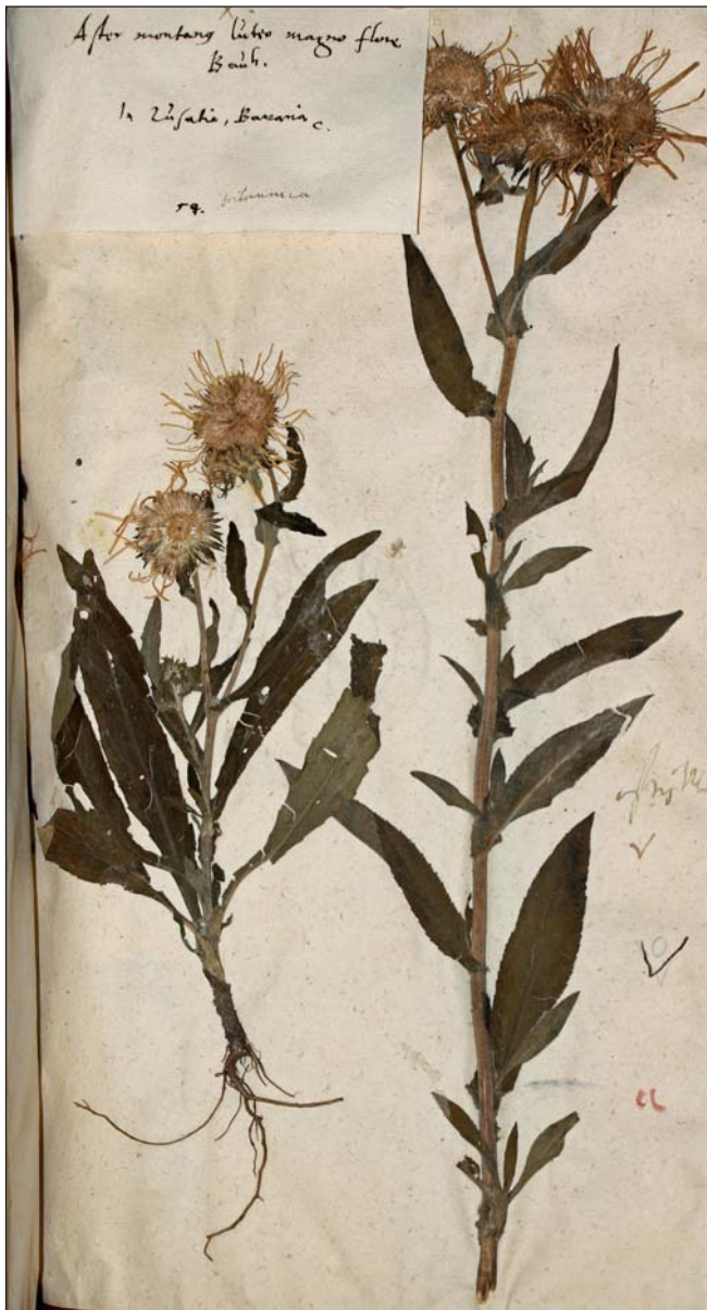
Fig. 2. – Material original de Linne conservado en el Herbario Burser XV(1): 54 (UPS-BURSER).