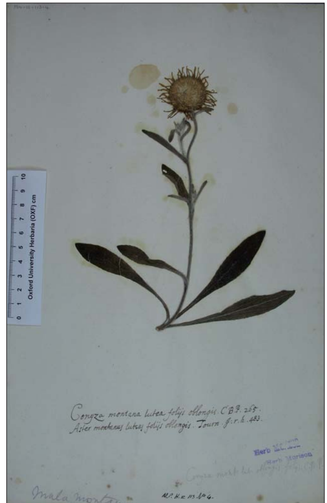
Fig. 3. – Epítipo de Inula montana L.

Según estos datos, se considera, por tanto, como el mejor candidato a lectótipo el grabado de Robert Morison bajo el nombre « Aster montanus luteo magno flore , C.B.P.» (MORISON, 1699: 119), ya que el material de herbario disponible no permite el uso tradicional y actual que se otorga al nombre de Linne. Por otro lado, con el fin de evitar cualquier ambigüedad en la interpretación del lectótipo seleccionado, un epítipo es aquí designado. En este sentido, tras la búsqueda de material