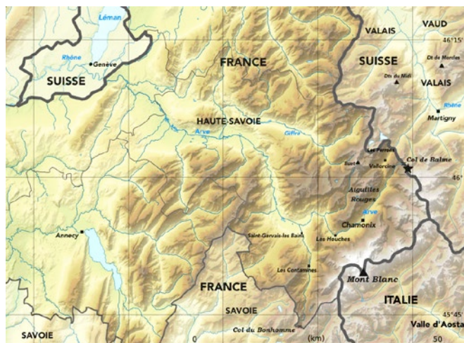
Fig. 2. – Carte topographique de situation de la zone d'étude, avec mention des localités citées dans le texte. La localité type est signalée par une étoile.

Certains échantillons tendent vers A. alpina , au point de faire hésiter des botanistes comme cette récolte du massif des Aiguilles Rouges de John Briquet déposée à G ( Briquet s.n. ) déterminée comme A. alpina , puis comme A. pubescens par Briquet que nous attribuons aussi à la nouvelle espèce. La pubes-