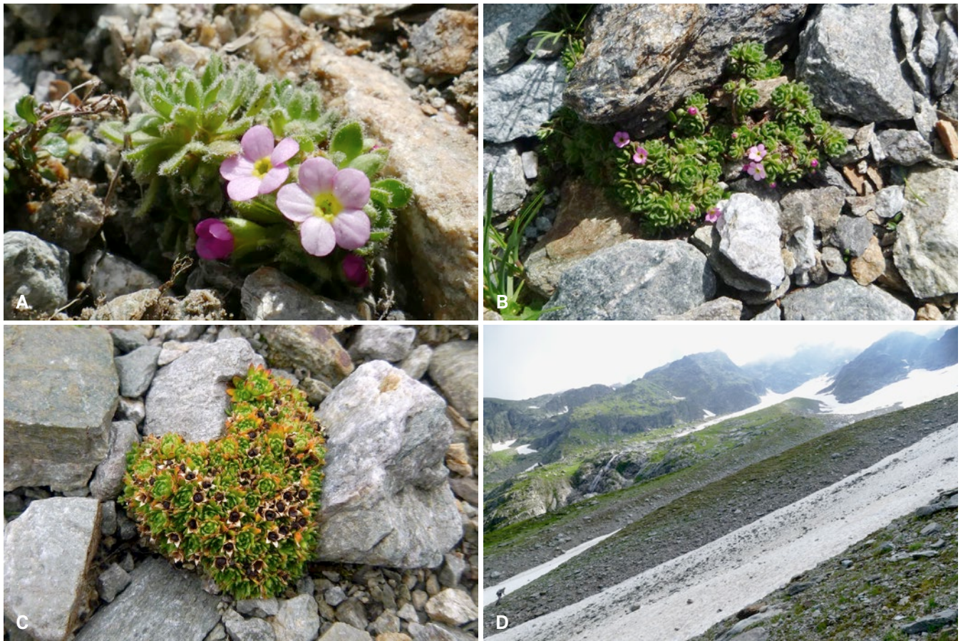
Fig. 4. – Androsace albimontana D. Jord. & Jacquemoud. A–B. Fleurs; C. Fruits; D. Milieu.

[A–B, D: Les Contamines, Armançette, moraine, 2200 m, 17.VII.2018; C: Vallorcine, moraine de Bérard, 1950 m, 20.VIII.2012]