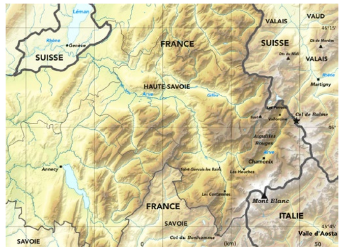
Fig. 2. – Carte topographique de situation de la zone d'étude, avec mention des localités citées dans le texte. La localité type est signalée par une étoile.

Certains échantillons tendent vers A. alpina , au point de faire hésiter des botanistes comme cette récolte du massif des Aiguilles Rouges de John Briquet déposée à G ( Briquet s.n. ) déterminée comme A. alpina , puis comme A. pubescens par Briquet que nous attribuons aussi à la nouvelle espèce. La pubes-