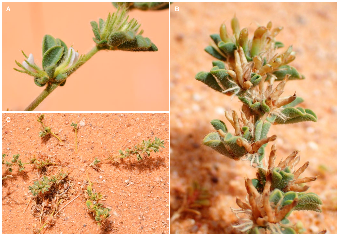
Fig. 2. – Lotus zemmouriensis C. Chatel., F. Andrieu & Dobignard. A. Inflorescence et feuilles; B. Infrutescence; C. Ecologie. [B–C: Chatelain 4375]

Notes. – Lotus zemmouriensis est affine de L. glinoides par sa morphologie rampante dans le sable, la forme de ses feuilles et la couleur blanc-rose de ses fleurs; elle en diffère par des gousses 5–6 fois plus courtes, une pilosité plus importante avec des poils hirsutes 2 à 3 fois plus longs, une corolle deux fois plus courte dépassant à peine le calice, qui est fortement hirsute. Cette espèce à l'état végétatif a probablement été souvent confondue avec Leobordea platycarpa (Viv.) B.-E. van Wyk & Boatwr. mais qui a des feuilles longuement pétiolées