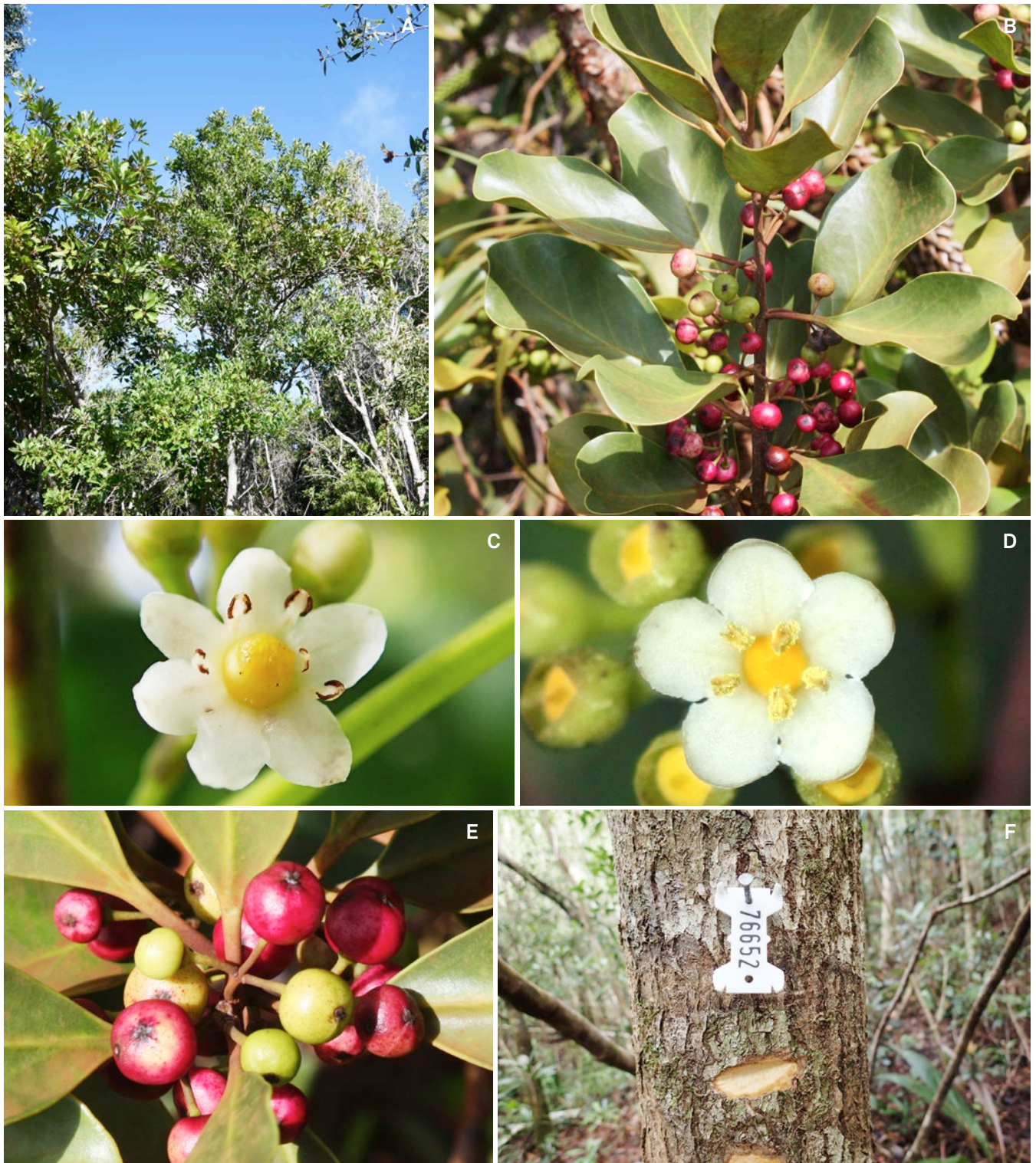
Fig. 1. – Ilex sebertii Pancher. A. Vue d'ensemble d'un petit arbre de 6–7 m de hauteur, Haut-Coulna (NUM), Hienghène, 16.VI.2021; B. Rameau feuillé et infrutescences, plateau de Bogota (UM), Canala, 6.V.2016; C. Fleur femelle (hexamère) montrant les staminodes et un ovaire bien développé, Forêt Plate (NUM), limite Pouembout-Ponérihouen, 3.XII.2015; D. Fleur mâle (pentamère) montrant des étamines fertiles et un pistillode au centre, Rivière des Lacs (UM), Yaté, 14.XII.2015; E. Détail de la fructification, plateau de Bogota (UM), Canala, 6.V.2016; F. Écorce et flache (section tangentielle) d'un arbre de 14 cm DBH, parcelle NC-PIPPN, Prokomeo (UM), Canala, 16.VII.2019. [Abréviations: DBH: diamètre à hauteur de poitrine; NUM: substrat non ultramafique; UM: substrat ultramafique]