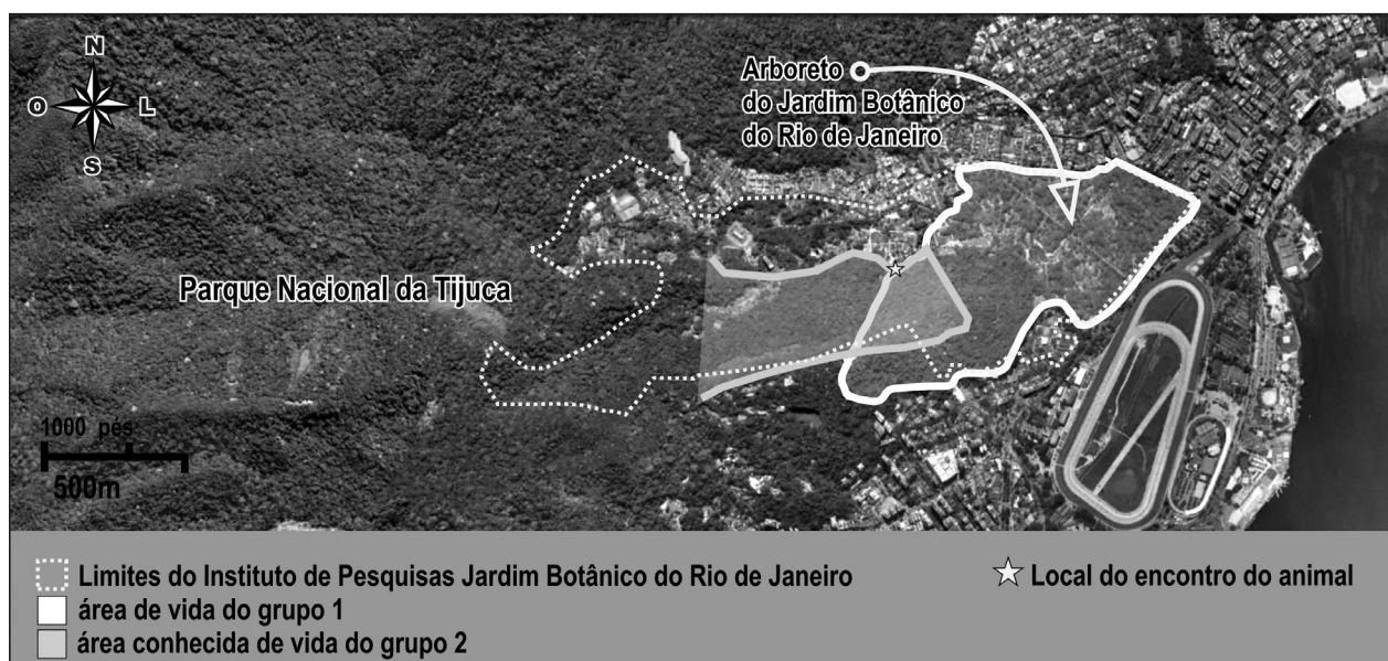
Figura 1. Detalhamento das áreas do Jardim Botânico do Rio de Janeiro ocupadas pelos grupos 1 e 2 de macacos-prego ( Sapajus nigritus ), indicando sua zona de sobreposição e local de encontro do animal ferido. Adaptado de Google Maps.

Desde 2007 o Projeto de Conservação da Fauna no JBRJ, um projeto de longa duração, monitora a comunidade de primatas de vida livre na área. Durante esse tempo, pelo menos um dia por semana há pesquisadores observando os grupos de macacos-prego, com esforço médio de 8 horas diárias, em estudos de área de vida, comportamento e dieta. Os macacos-prego dos grupos estudados foram classificados como Sapajus nigritus devido às suas características morfológicas, de acordo com Silva Jr. (2001). Dois grupos de Sapajus nigritus vem sendo acompanhados desde 2007. O grupo 1 usa o arboreto e parte baixa da área de mata secundária do JBRJ, é o mais avistado, estudado e com composição conhecida. O grupo 2, que usa a parte mais alta da mata secundária, se sobrepõe parcialmente com a área do grupo 1 (Fig. 1), e é avistado apenas ocasionalmente. Na data da observação do animal ferido, o grupo 1 de macacos-prego possuía 21 indivíduos: três machos adultos, dois machos sub adultos, sete fêmeas adultas, quatro jovens, e cinco infantes. Nas poucas ocasiões em que o grupo 2 foi acompanhado, seu tamanho estimado foi de cerca de 10 indivíduos, com possibilidade de haver mais.