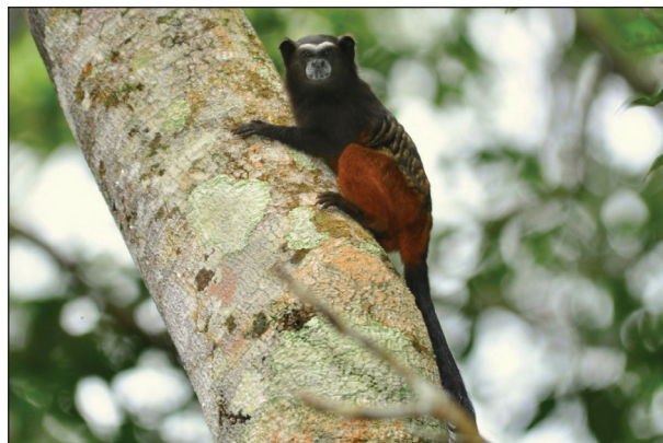
Figura 1. Saguinus weddelli em Vila Boa Esperança, Chupinguaia (Localidade # 34).

dados de Ferrari et al. (1996), Ferrari et al. (1998), Gusmão et al. (2008) e Selhorst (2008). Posteriormente, Ferrari et al. (2010), Gusmão et al. (2010b) e Alves et al. (2012) publicaram novas ocorrências além desse limite. No presente estudo, das 39 localidades com registros de S. weddelli , oito representam novos registros (Tabela 1; Fig. 2). S. weddelli ocorre na maior parte do estado de Rondônia, e seus limites de distribuição parecem ser delineados principalmente por barreiras fluviais. Dos oito novos registros, um situa-se na porção nordeste, três no centro-leste, e quatro no centro-sul de Rondônia.