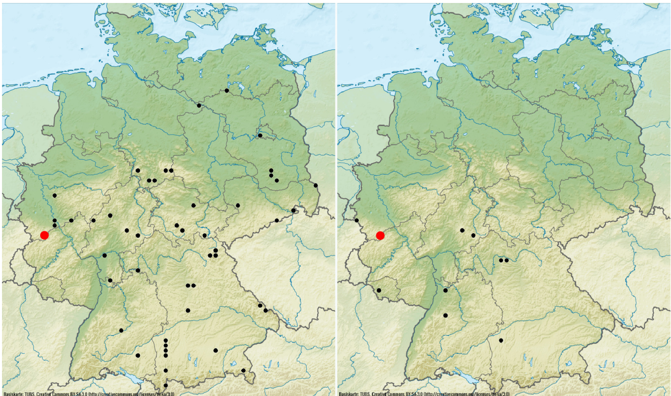
Abb. 3: Verbreitung von Gibbaranea omoeda (links) und Oreonetides quadridentatus (rechts) in Deutschland (Arachnologische Gesellschaft 2017). Die hier dargestellten Nachweise sind rot eingefärbt.