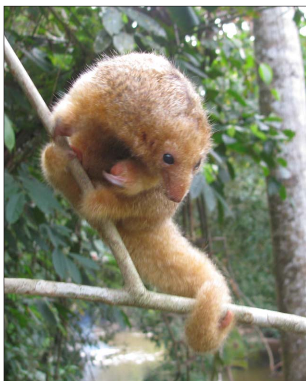
FIGURA 1. Cyclopes didactylus encontrado en la Vereda Zancón, cuenca del río Manso, al interior del Parque Nacional Natural Paramillo en el departamento de Córdoba, Colombia.