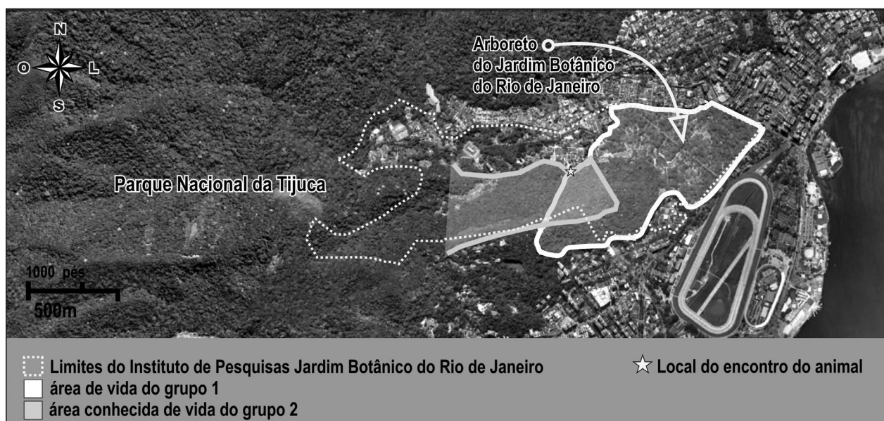
Figura 1. Detalhamento das áreas do Jardim Botânico do Rio de Janeiro ocupadas pelos grupos 1 e 2 de macacos-prego ( Sapajus nigritus ), indicando sua zona de sobreposição e local de encontro do animal ferido. Adaptado de Google Maps.

Desde 2007 o Projeto de Conservação da Fauna no JBRJ, um projeto de longa duração, monitora a comunidade de primatas de vida livre na área. Durante esse tempo, pelo menos um dia por semana há pesquisadores observando os grupos de macacos-prego, com esforço médio de 8 horas diárias, em estudos de área de vida, comportamento e dieta. Os macacos-prego dos grupos estudados foram classificados como Sapajus nigritus devido às suas características morfológicas, de acordo com Silva Jr. (2001). Dois grupos de Sapajus nigritus vem sendo acompanhados desde 2007. O grupo 1 usa o arboreto e parte baixa da área de mata secundária do JBRJ, é o mais avistado, estudado e com composição conhecida. O grupo 2, que usa a parte mais alta da mata secundária, se sobrepõe parcialmente com a área do grupo 1 (Fig. 1), e é avistado apenas ocasionalmente. Na data da observação do animal ferido, o grupo 1 de macacos-prego possuía 21 indivíduos: três machos adultos, dois machos sub adultos, sete fêmeas adultas, quatro jovens, e cinco infantes. Nas poucas ocasiões em que o grupo 2 foi acompanhado, seu tamanho estimado foi de cerca de 10 indivíduos, com possibilidade de haver mais.