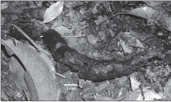
Figura 1. Amostra fecal de Leopardus pardalis encontrada em dezembro de 2012 na Área de Relevante Interesse Ecológico Floresta da Cicuta.