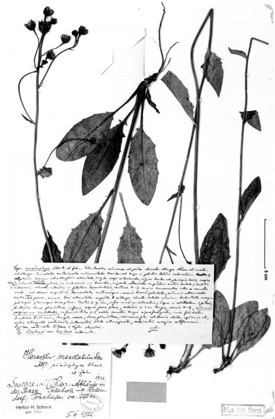
Fig. 5. Typus von Hieracium maculatum subsp. sciadophyes Schack & Zahn mit handschriftlicher Diagnose von K. H. Zahn.