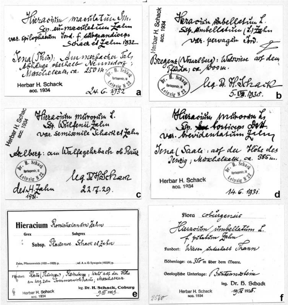
Fig. 3. Etiketten aus dem Herbarium von Hans Schack mit seiner Handschrift. Mit einem "Z" hat K. H. Zahn die ihm vorgelegenen Belege versehen. Die Angabe "Herbar H. Schack, acc. 1934" wurde im Botanischen Museum Berlin-Dahlem aufgestempelt.

che Betreuung des von Otto Behr in Forst herausgegebenen Exsikkatenwerkes "Herbarium Hieraciorum". Noch im Jahre 1944 wurde ihm von Rothmaler die Übernahme der Gattung Hieracium für die von diesem initiierte "Flora von Europa" angetragen, ein Angebot, das Schack mit Hinweis auf seinen schlechten Gesundheitszustand und den vermeintlichen Untergang seiner Sammlungen in Berlin-Dahlem, resignierend ablehnte (6).