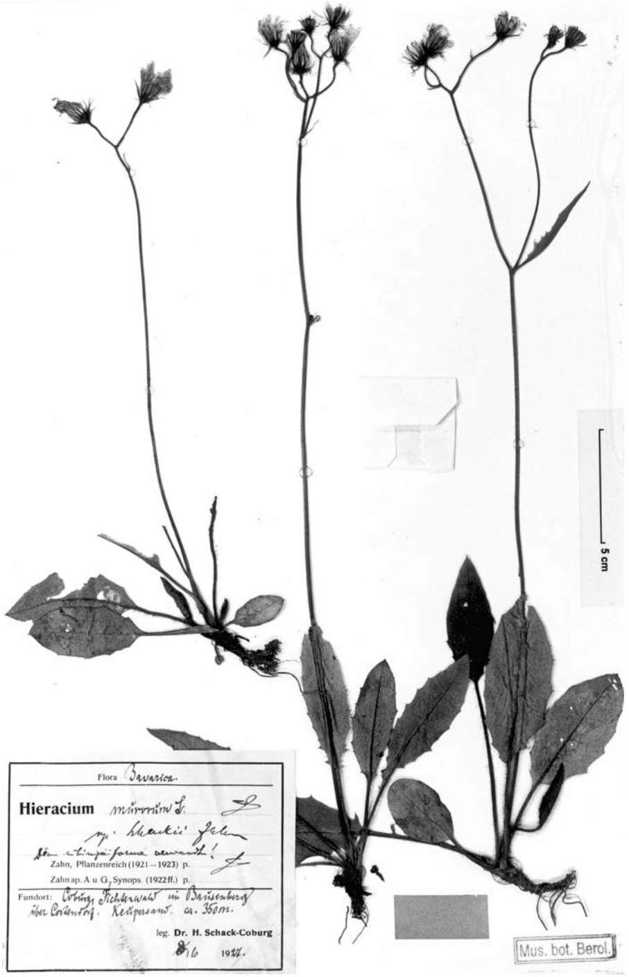
Fig. 2. Typus von Hieracium murorum subsp. schackii Zahn mit handschriftlichen Bestimmungsangaben von K. H. Zahn.