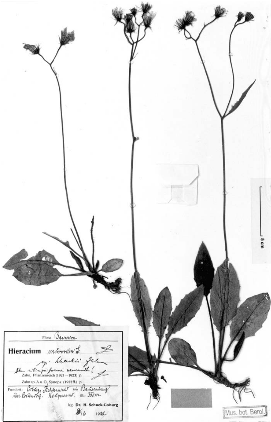
Fig. 2. Typus von Hieracium murorum subsp. schackii Zahn mit handschriftlichen Bestimmungsangaben von K. H. Zahn.