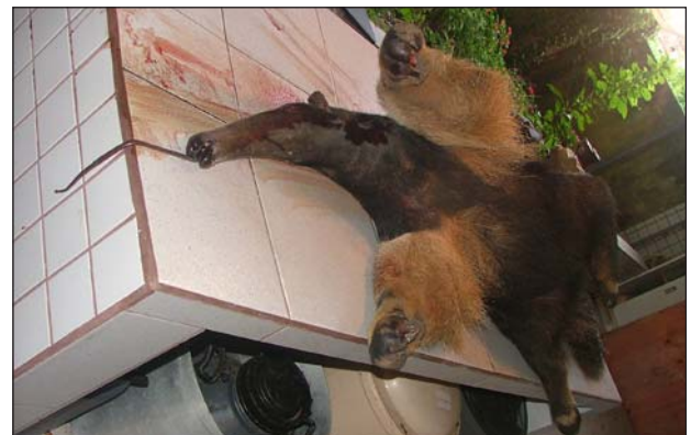
FIGURA 2. Macho de tamanduá-bandeira ( Myrmecophaga tridactyla ) atropelado na PR-090, em Piraf do Sul, no mês de novembro de 2002, e depositado no Museu de História Natural Capão da Imbuia (MHNCI), em Curitiba.

No Parque Estadual de Vila Velha, município de Ponta Grossa, no ano de 1983 um tamanduá-bandeira foi encontrado morto por atropelamento na rodovia BR 376 que corta o parque (Fernando C. Straube, com. pess., 1999). No ano de 1984 foram registradas