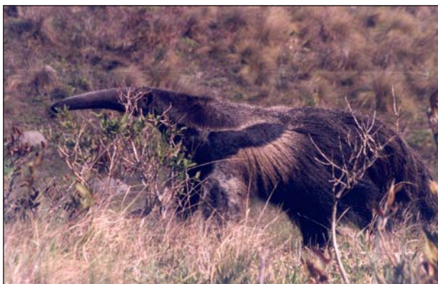
FIGURA 3. Tamanduá-bandeira ( Myrmecophaga tridactyla ) observado na fazenda 4N, município de Pirai do Sul, em setembro de 2002.

Relatos de moradores da fazenda Monte Negro no município de Pirai do Sul, vizinho a Jaguariaíva, informaram que há pouco mais de 15 anos os tamanduás ainda eram avistados regularmente e constantemente mortos por caçadores. Até a década de 1990, os tamanduás-bandeira eram “laçados”, como o gado, pelos fazendeiros e peões para serem fotografados junto às suas famílias. Essa prática deixou