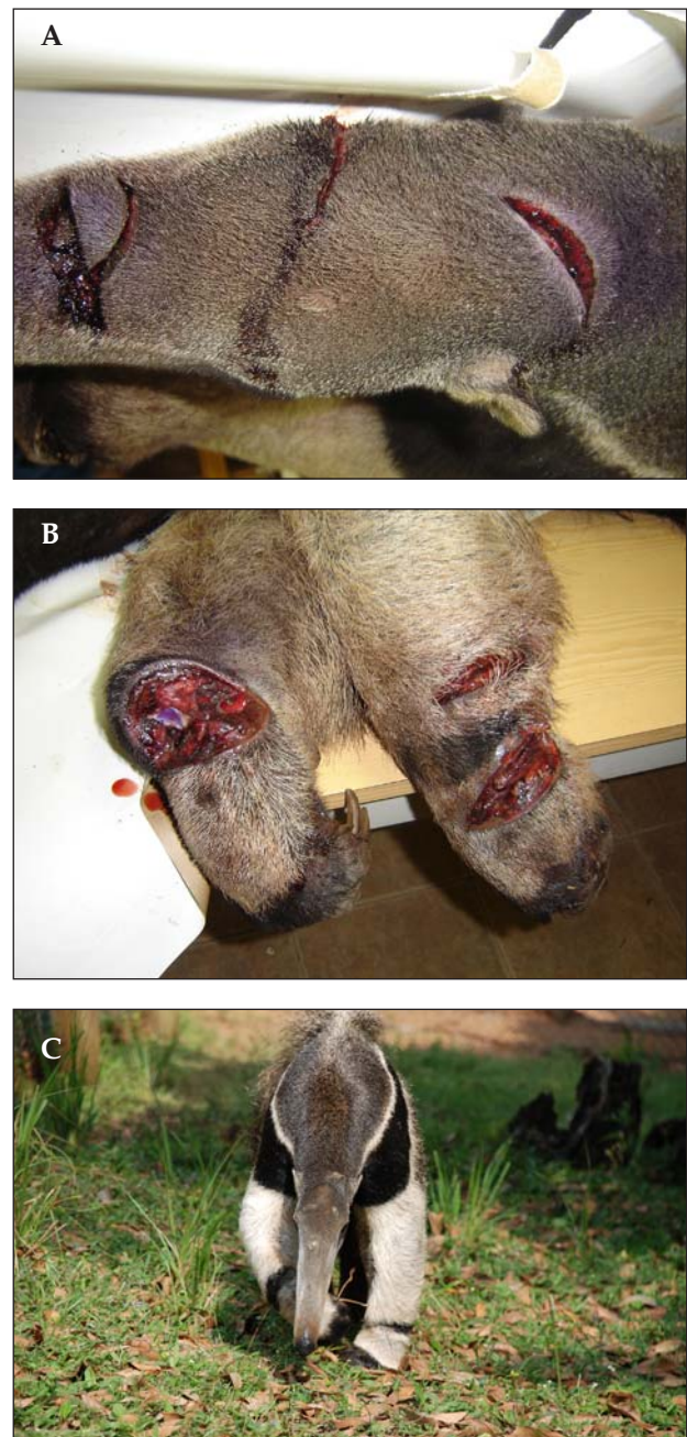
FIGURA 4. Indivíduo macho de tamanduá-bandeira ( Myrmecophaga tridactyla ), resgatado no bairro Cavernas, município de Pirai do Sul, em novembro de 2005: (A) e (B) detalhes dos ferimentos, (C) após a sua recuperação, em cativeiro.

de ocorrer pela dificuldade de localização dos indivíduos remanescentes. Em fevereiro de 2002 um indivíduo foi observado transitando entre os capões (ilhas florestais com Araucária em meio às áreas de Campos) da fazenda Monte Negro. Em propriedade vizinha (fazenda 4N) foram feitos registros visuais e fotográficos de pelo menos três indivíduos distintos (Fernanda G. Braga, obs. pess.) (FIG. 3). Ainda em Pirai do Sul, no bairro Cavernas, um indivíduo, macho, foi encontrado no dia 15 de novembro de 2005 com ferimentos (FIG. 4) feitos por caçadores que invadiram uma propriedade rural (Vlamiir J. Rocha, com.