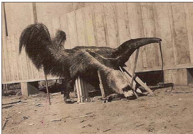
FIGURA 1. Tamanduá-bandeira ( Myrmecophaga tridactyla ), abatido no município de Paranavaí no ano de 1950.

A confirmação da ocorrência da espécie através de exemplares de museu ocorreu apenas em