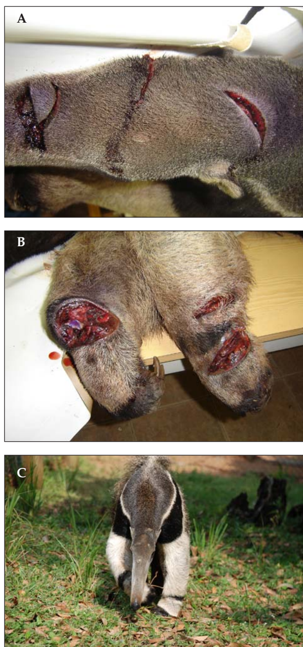
FIGURA 4. Indivíduo macho de tamanduá-bandeira ( Myrmecophaga tridactyla ), resgatado no bairro Cavernas, município de Pirai do Sul, em novembro de 2005: (A) e (B) detalhes dos ferimentos, (C) após a sua recuperação, em cativeiro.

de ocorrer pela dificuldade de localização dos indivíduos remanescentes. Em fevereiro de 2002 um indivíduo foi observado transitando entre os capões (ilhas florestais com Araucária em meio às áreas de Campos) da fazenda Monte Negro. Em propriedade vizinha (fazenda 4N) foram feitos registros visuais e fotográficos de pelo menos três indivíduos distintos (Fernanda G. Braga, obs. pess.) (FIG. 3). Ainda em Pirai do Sul, no bairro Cavernas, um indivíduo, macho, foi encontrado no dia 15 de novembro de 2005 com ferimentos (FIG. 4) feitos por caçadores que invadiram uma propriedade rural (Vlamiir J. Rocha, com.